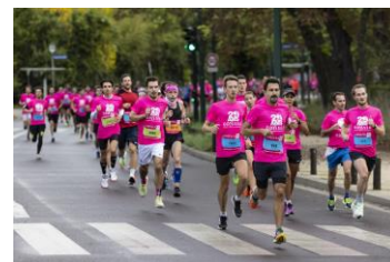
Photos libres de droit, téléchargeable sur https://flic.kr/s/aHBqjA9DYR